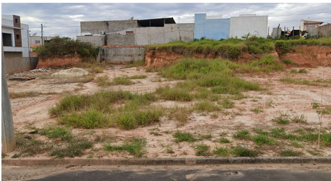
Figura 1 - Fachada do imóvel

André Ferreira Gonçalves CRECI nº 228757